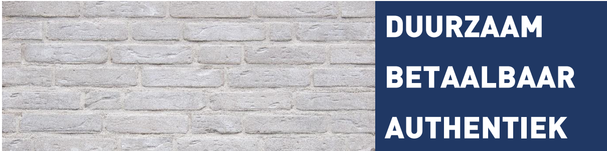
Foto 1 Lowie Rustiek Wit WF HV

Hoewel we elke dag worden omringd door miljoenen bakstenen, denken de meesten van ons niet te vaak na over bakstenen. Al duizenden jaren zijn bakstenen van klei niet veranderd en lange tijd leek het erop dat dat ook nooit zou gebeuren. Maar alles verandert en dat geldt dus ook voor bakstenen. Feit is dat het traditionele energie-intensieve bakproces bij hoge temperaturen gewoonweg niet duurzaam is. Alleen een radicale verandering in de productiemethode kan de klassieke baksteen behouden die we allemaal erg waarderen.