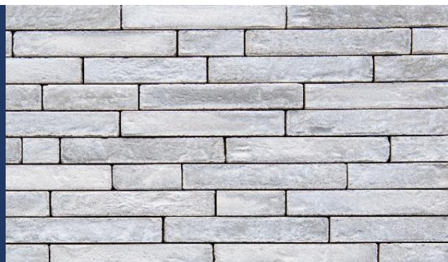
Foto 2 Lowie Ontwerp Wit Grijs HV HF

"Wij geloven dat echte ecologische vooruitgang alleen mogelijk is als het ook betaalbaar is"